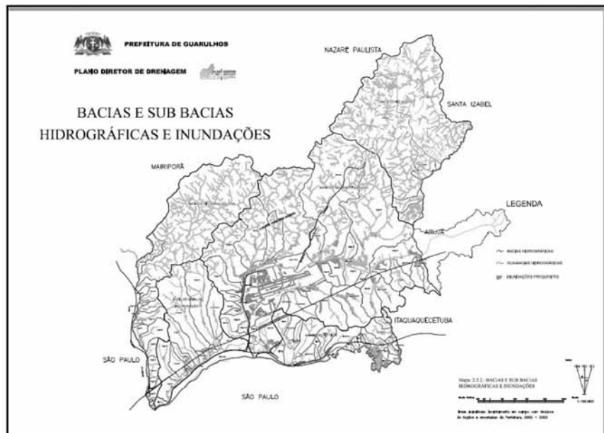
Figura 4 - Mapa de Bacias e sub-bacias e Inundações – Plano Diretor Enger