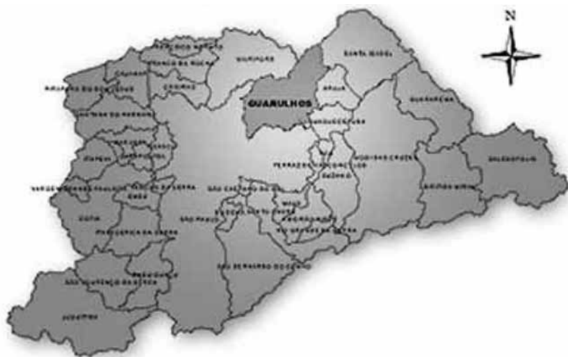
Figura 1 - Mapa – Localização do município na região metropolitana

Recebeu nas últimas décadas, diversos grupos populacionais que chegaram em busca de oportunidades de emprego e moradia.