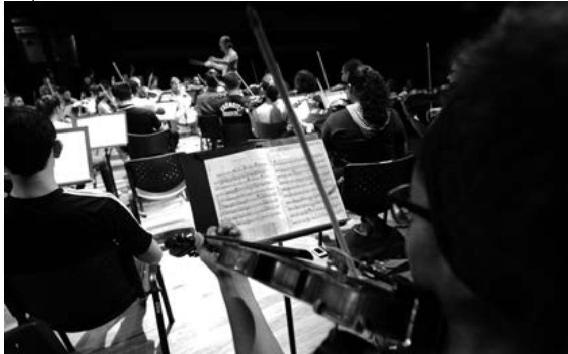
A clássica Sinfonia nº 5 de Ludwig van Beethoven vai abrir a temporada 2016 da Orquestra Jovem