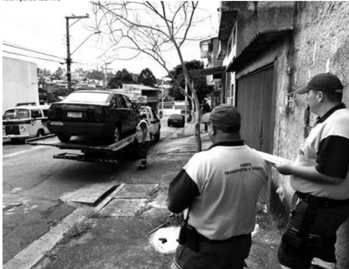
A nova metodologia de trabalho, por região, possibilita efetuar remoções com mais agilidade

representando 15% a mais em relação ao ano anterior.