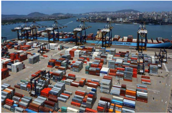
PORTO DE SANTOS (SP)