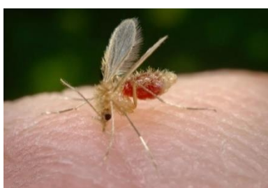
Mosquito-palha costuma ser o transmissor do protozoário da leishmaniose em áreas urbanas — Foto: James Gathany/CDC

https://g1.globo.com/mt/mato-grosso/noticia/2022/05/26/caso-de-leishmaniose-em-crianca-e-confirmado-em-rondonopolis-mt.ghtml