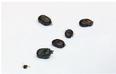
Carrapato-estrela, transmissor da febre maculosa

https://g1.globo.com/sp/sao-carlos-regiao/noticia/2022/06/30/leme-confirma-1a-morte-por-febre-maculosa-no-ano.ghtml