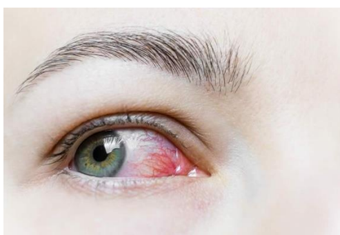
Olhos irritados

https://www.diariolasamericas.com/florida/nueva-subvariante-covid-19-trae-conjuntivitis-n5334691