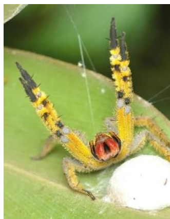
Aranha-armadeira ( Phoneutria boliviensis ) protegendo a ooteca ("bolsa" de ovos)

https://g1.globo.com/sp/campinas-regiao/terra-da-gente/noticia/2023/04/26/armadeiras-epoca-traz-alerta-sobre-risco-de-picadas.ghtml