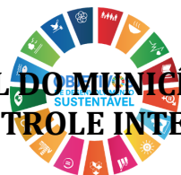
Figura 3 - Plano Anual de Auditorias Internas 2021