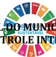
Figura 4 - Auditorias realizadas em 2023