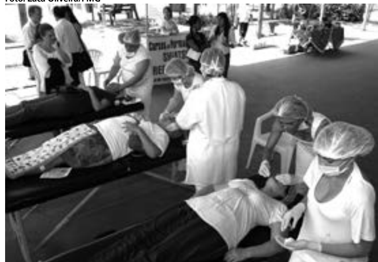
Beneficiários de programas sociais têm prioridade nos cursos