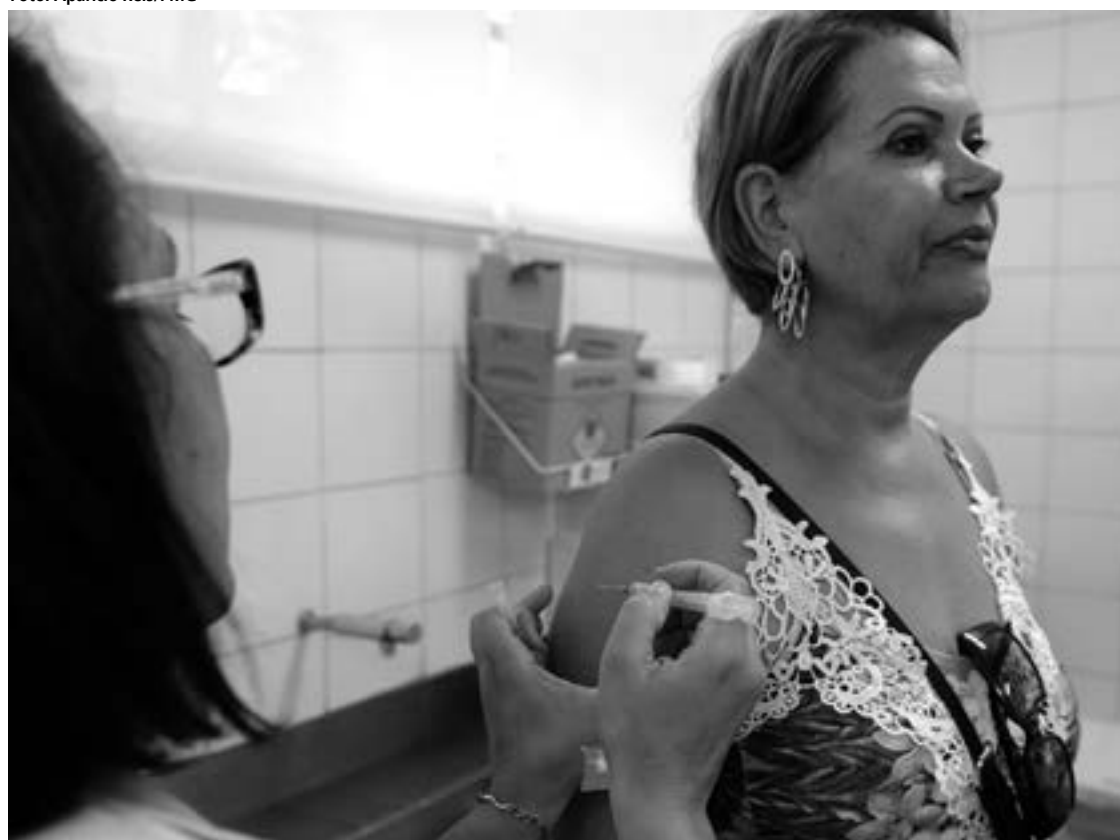
Crianças, gestantes e idosos estão entre as pessoas com prioridade para receberem a vacina

UBS irão funcionar das 8 às 17 horas para intensificar a imunização, durante o Dia Nacional de Mobilização.