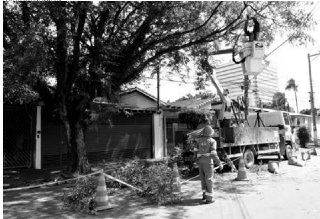
Podas de árvores devem ocorrer somente com parecer técnico de profissional habilitado pela Sema