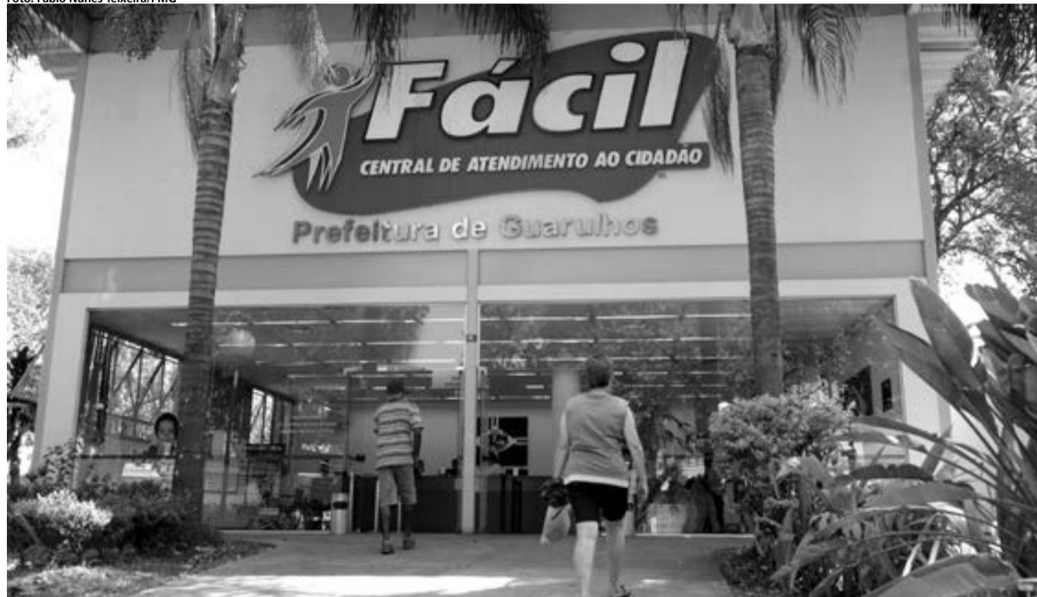
A unidade do Fácil Bom Clima (localizada no Paço Municipal) é a pioneira da Rede Fácil e a única que funciona aos sábados

no Itapegica (praça Leônidas P. Figueiredo, esquina com a rua Maria Cândida Pereira). O horário de funcionamento é de segunda a sexta-feira, das 10 às 16 horas. Em operação desde meados de 2012, a unidade volante contabiliza mais de 45,5 mil atendimentos e já