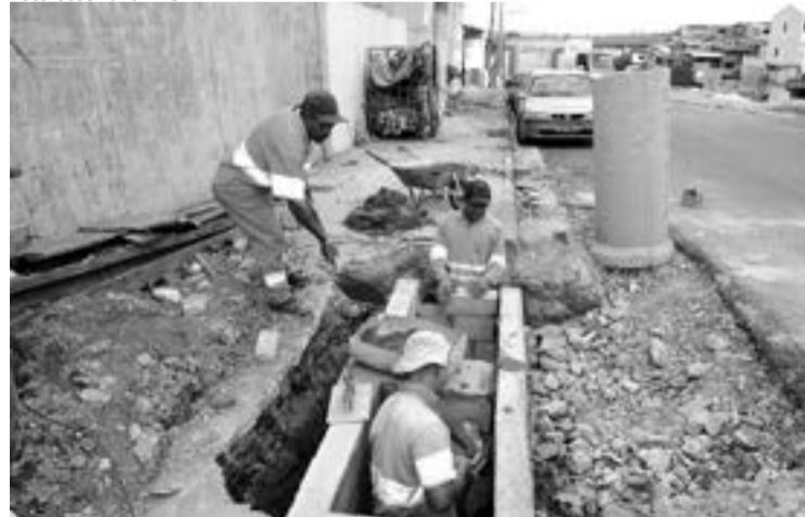
Os serviços na rua Indiaporã estão orçados em R$ 620 mil

mil e têm prazo de conclusão de 12 meses. A obra faz parte de um programa de pavimentação realizado na CIS Cumbica, que vai levar obras de infraestrutura a 53 ruas da