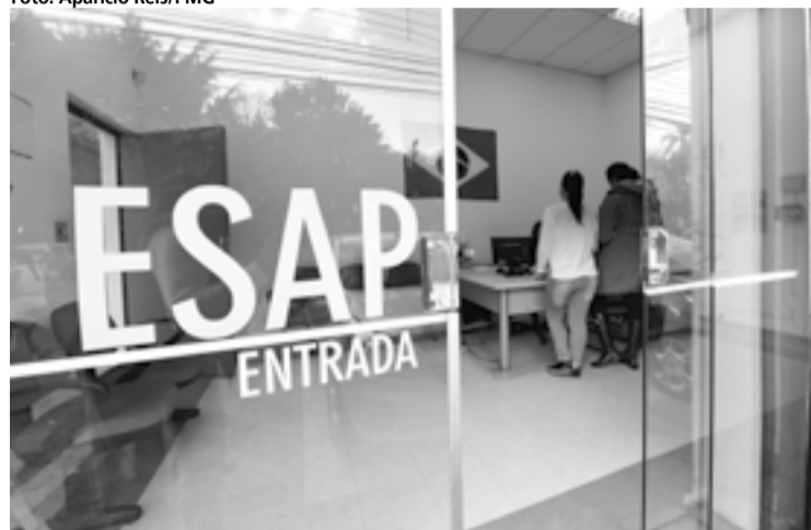
A Esap é exemplo de investimento na melhoria do serviço público

Departamento de Modernização Administrativa como técnicas de comunicação e expressão oral, introdução ao geoprocessamento, atos administrativos e redação oficial, história de Guarulhos, atendimento ao público, gestão documental e a lei de acesso à informação, gestão de conflitos, entre outros.