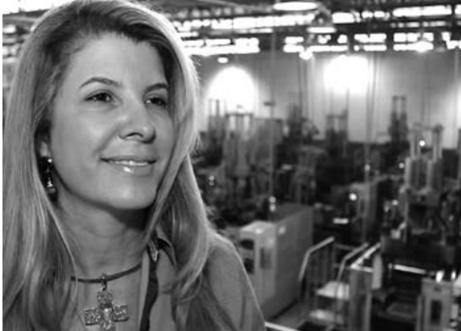
Para Simone, da Mobensani, iniciativas fortalecem os vínculos com o município