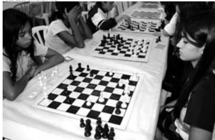
O xadrez também faz parte das atividades esportivas oferecidas