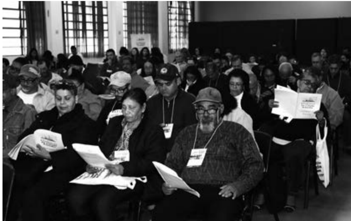
Representantes de vários segmentos da sociedade participaram da Conferência no Adamastor

Outra ideia de interesse do município e que foi consenso entre os participantes está relacionada ao abastecimento de água. A cidade precisa que a oferta de água tratada seja ampliada.