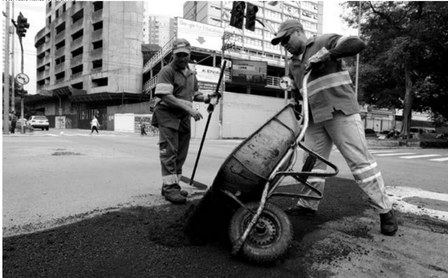
A segunda etapa da Operação Asfalto já foi deflagrada por equipes da Proguaru, com ações no centro expandido da cidade

equipes atuam na região do Centro expandido - duas no período da manhã e duas durante a tarde - e outras quatro atenderão a periferia da cidade, possibilitando melhor atendimento nos qua-