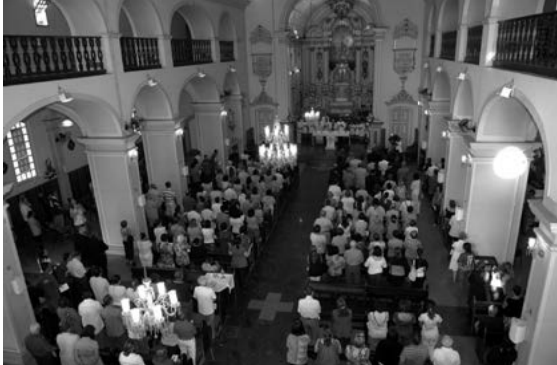
A Missa da Padroeira Nossa Senhora da Conceição acontece na próxima terça-feira, às 8 horas