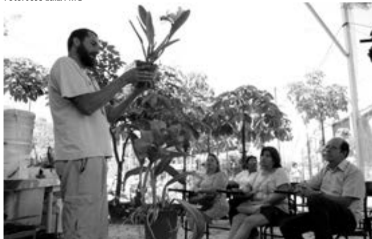
O Orquidário Municipal oferece oficinas para o cultivo da planta

"rainha das orquídeas", por sua forma robusta e as cores marcantes.