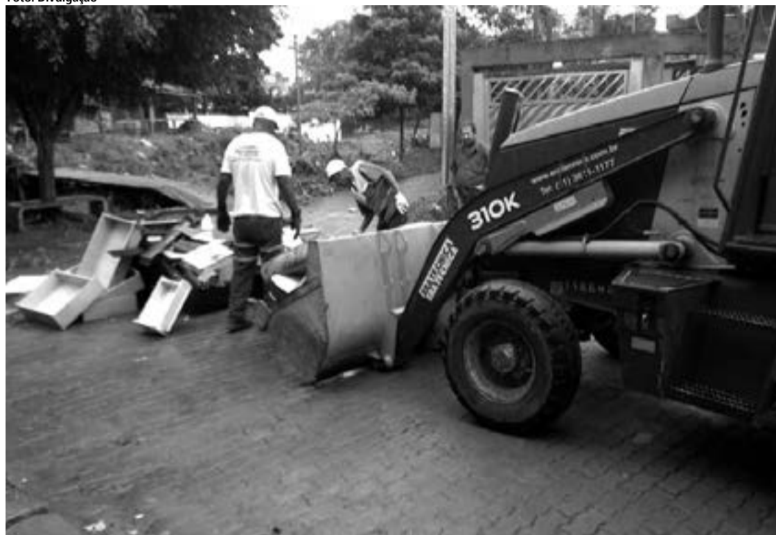
Desenvolvida pelas regionais, a ação contempla limpeza e manutenção de vias e áreas públicas

Solidariedade, 26 (Jd. Santa Maria), e remoção de capim na av. River (Jd. Piratininga).