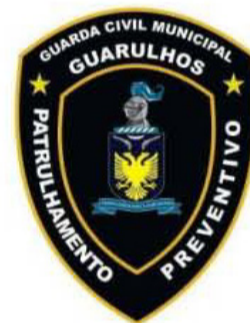
LOGOTIPO DA GUARDA CIVIL MUNICIPAL